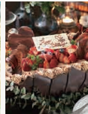
ロマンティックショコラ