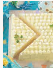
ダブルフロマージュ