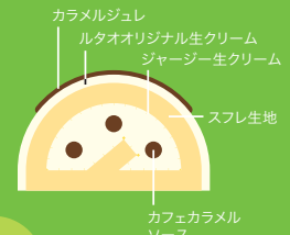
カフェキャラメル ソース